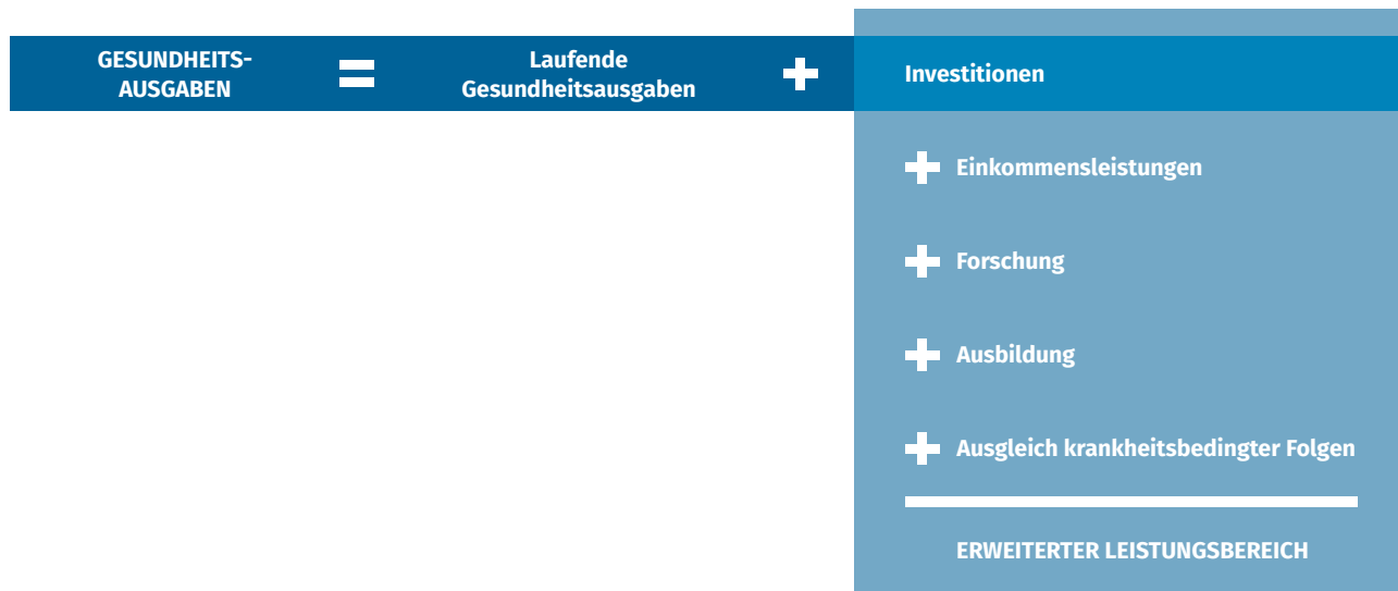
Abbildung 1 Zusammensetzung der Gesundheitsausgaben und des erweiterten Leistungsbereichs